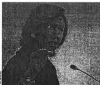
Ana Botella, presidenta de Santander

E. del Pozo Alcázar Grupo Santander realizó el año pasado una aportación total de 769 millones de euros a los fondos de garantía constituidos en los países en los que está presente para proteger el ahorro de los usuarios. El desembolso es un 33% superior al registrado por la entidad en el ejercicio precedente (577 millones). Este fuerte incremento está motivado por el aumento de las aportaciones extraordinarias realizadas por Santander, principalmente en Polonia, y también en España y Argentina, según explica el grupo en su informe de cuentas de 2015. El aumento de la aportación requerida en Polonia, el mayor, se debe a la quiebra de SK Wolomin Bank, el banco cooperativo más grande del país, lo que obligó al sector a